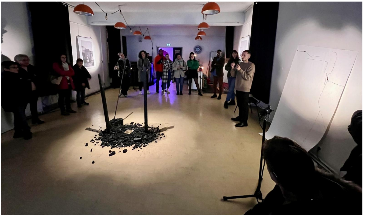
Exposition Guillaume COUSIN